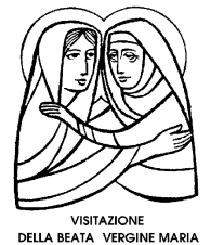
VISITAZIONE DELLA BEATA VERGINE MARIA

Ore 20.00: S. Messa a conclusione del mese di Maggio