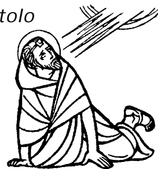
CONVERSIONE DI SAN PAOLO

Ore 08.30: non ci sarà la S.Messa ma la Liturgia delle Lodi