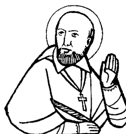
SAN FRANCESCO DI SALES vescovo e dottore della Chiesa