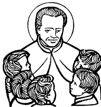
SAN GIOVANNI BOSCO sacerdote

Ore 11.00: S. Messa con la presenza dei bambini battezzati nel 2017